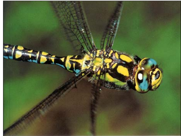
Libelleninventar des Kantons Bern

Das kantonale Libelleninventar aus dem Jahre 1994 erfasst Vorkommen, Verbreitung und Gefährdung dieser wichtigen Artengruppe (siehe Kapitel "Libellen").