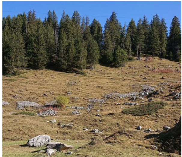
Strukturreicher Südhang im Berner Oberland