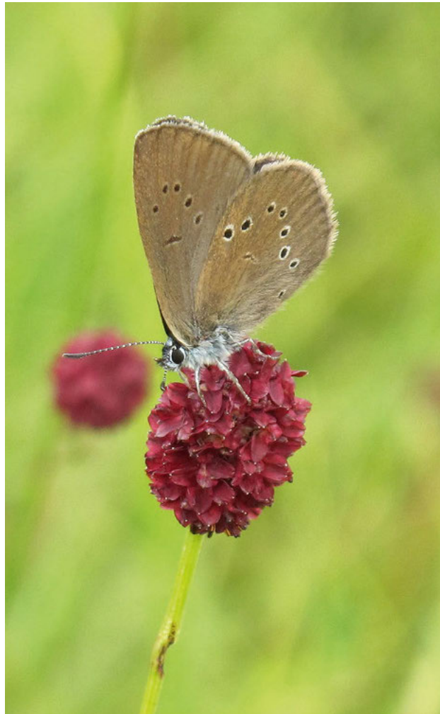
Abbildung 2: Dunkler Moorbläuling auf der Blüte des Grossen Wiesenknopfs.

Wichtig ist, dass zu Beginn der Flugzeit eine Vielzahl blühende Grosse Wiesenknöpfe für die Eiablage zur Verfügung stehen und diese möglichst erst ab dem 15. September, wenn die meisten Raupen die Blütenköpfe verlassen haben, gemäht werden. Auch das Stehenlassen von Altgras, bzw. Rückzugsflächen ist wichtig, da mit dieser Massnahme die Bestände von Ameisen und Grossen Wiesenknöpfen gefördert werden können.