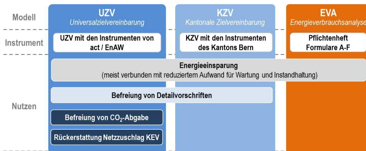
Darstellung 2 - Synergien der Umsetzungsvarianten